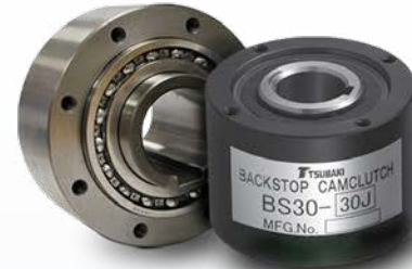
Embrayage à Cam Antidévireur