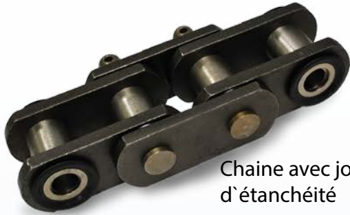
Chaîne avec joint d'étanchéité