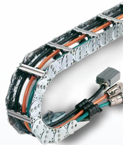
Porte cable en acier