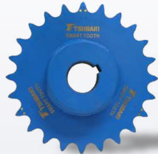
Roue dentée avec dent intelligente