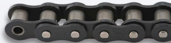
Chaîne auto-lubrifiante Lambda